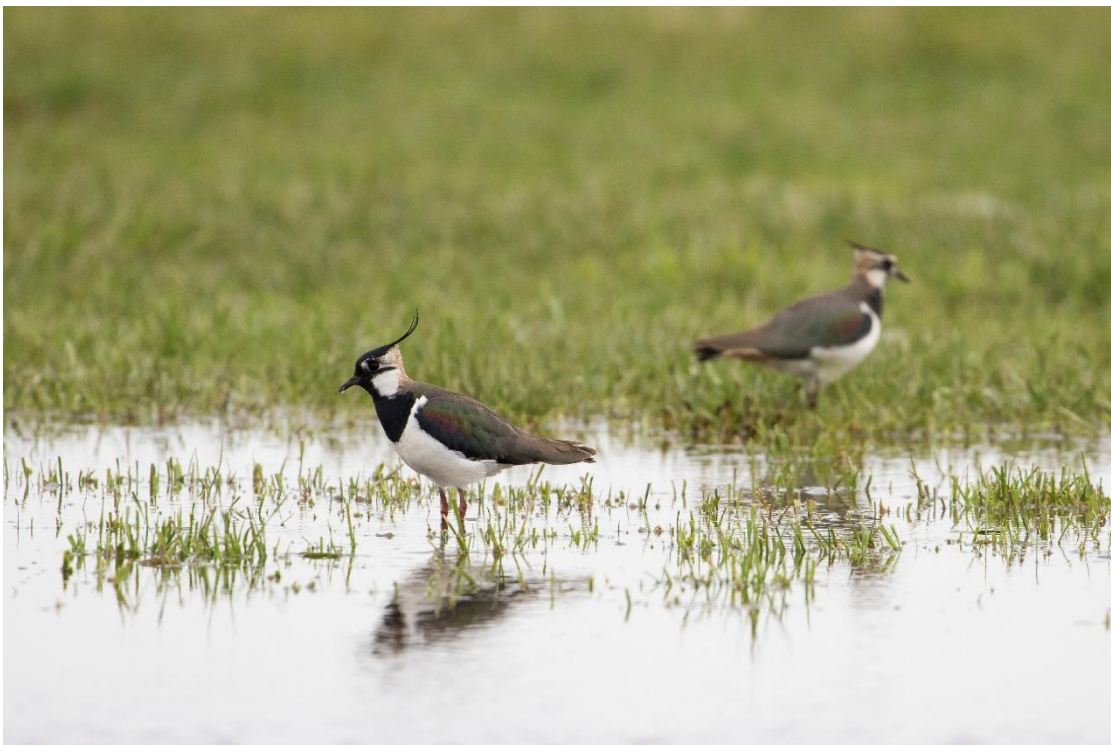
Kievit op plasdras

De vereenvoudiging van de regels door de Provincie heeft de mogelijkheid gegeven beter beheer af te sluiten. Het ruimer kunnen omgaan met de regels zorgt ervoor dat de goede dingen op de goede plaats gedaan kunnen worden.