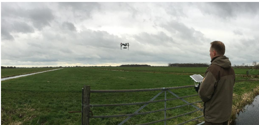
Drone piloot aan het werk

Met het Louis Bolk instituut hebben we pilots uitgevoerd omtrent het inzaaien van kruidenrijke mengsels. Door de droge zomer van 2018 zijn de resultaten niet altijd optimaal. In 2019 wordt de samenwerking uitgebreid met een pilot project omtrent beweiding van percelen, gericht op weidevogelbeheer. Deze pilot vindt plaats op percelen van Provincie Zuid Holland, waarop het ACK het beheer mag uitvoeren met deelnemende agrariërs.